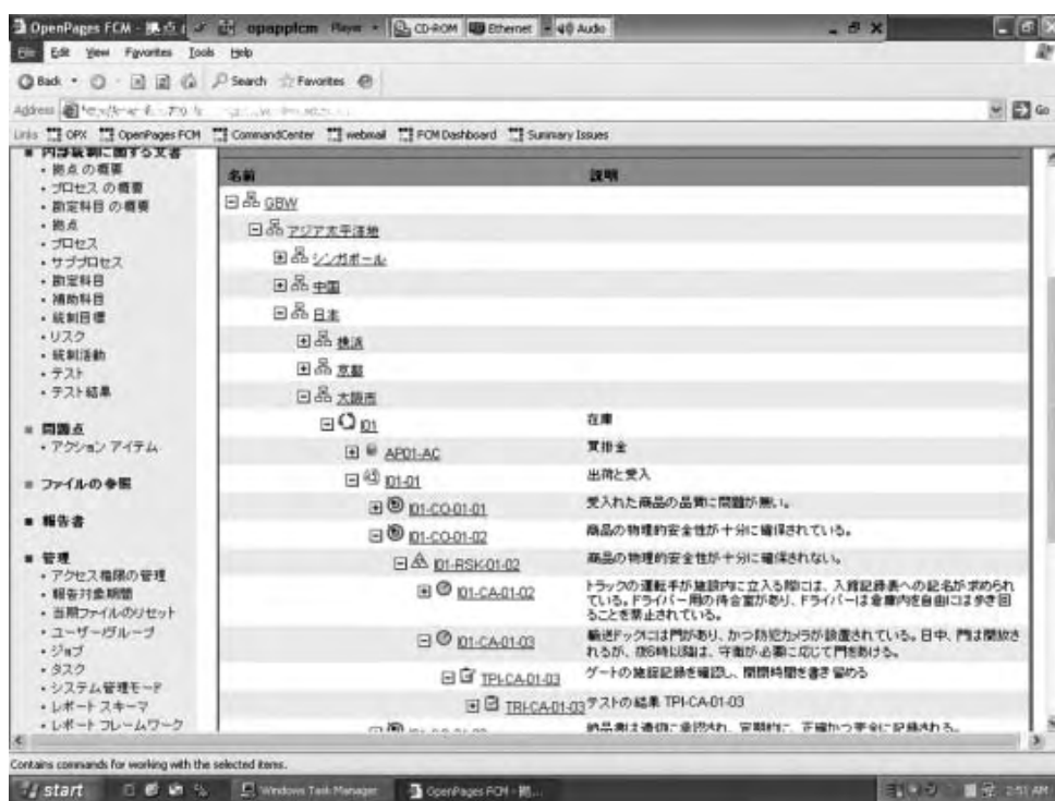
図1 コンプライアンスのためのリポジトリ